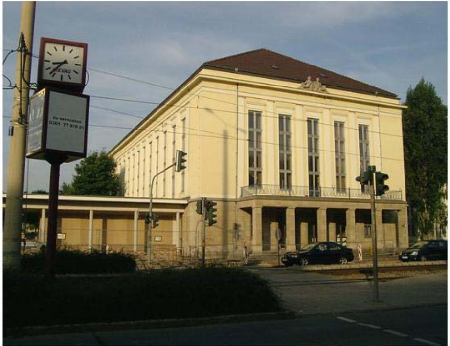
H Gebäude 1 (AudiMax): direkt neben dem Haupteingang der Universität (Blick von der Tramhaltestelle der Linien 3 und 6 direkt gegenüber)